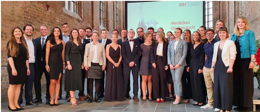
Feierliche Verabschiedung der ersten Absolventen der Medizinischen Hochschule Brandenburg

einen ersten Beitrag zur Behebung des Ärzt*innenmangels und zur bestmöglichen Patient*innenversorgung im Land Brandenburg. Das ist nicht nur für unsere junge Universität und unsere kooperierenden Kliniken, sondern auch für das gesamte Land Brandenburg ein schöner Erfolg und wahrlich